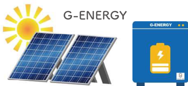
太陽光発電・蓄電池